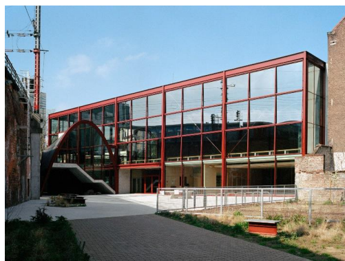
Photo de la situation existante extraite de la demande