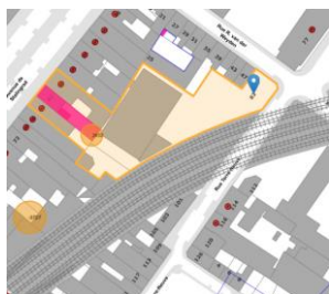
Implantation du bien

En réponse à votre courrier du 09/12/2024, nous vous communiquons l'avis émis par la CRMS en sa séance du 18/12/2024, concernant la demande sous rubrique.