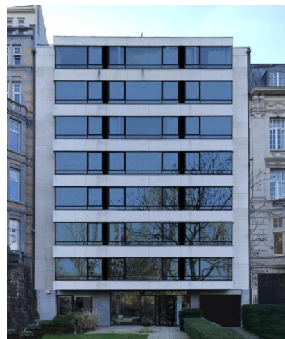
Situation existante et montage photo de la situation projetée (documents extraits de la demande)

Toutefois, pour mieux inscrire la façade dans le front bâti et le paysage urbain constitué par l'avenue des Gaulois et le parc du Cinquantenaire, et bien que le projet n'impacte pas directement les perspectives vers et depuis l'ensemble classé formé par les Musées du Cinquantenaire, la CRMS recommande l'utilisation de menuiseries de couleur claire.