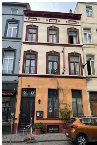
Photo de la façade actuelle, extraite de la demande

En réponse à votre courrier du 12/12/2024, nous vous communiquons l'avis émis par la CRMS en sa séance du 18/12/2024, concernant la demande sous rubrique.