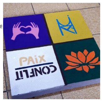
Extraits du dossier de demande