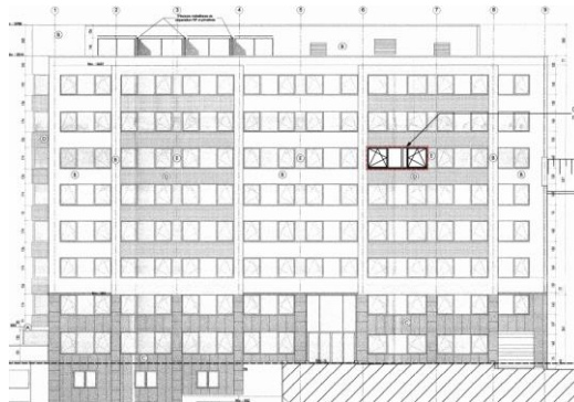
Façade à rue. Situation projetée. Image tirée du dossier

Le remplacement des châssis n'aura pas d'impact défavorable sur les vues vers et depuis le pont classé. Le changement d'utilisation de l'immeuble relève d'un examen urbanistique plutôt que patrimonial.