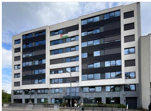
Façade à rue avec la localisation, en rouge, des châssis qui seront remplacés.

En réponse à votre courrier du 03/01/2025, nous vous communiquons l'avis émis par la CRMS en sa séance du 15/01/2025, concernant la demande sous rubrique.