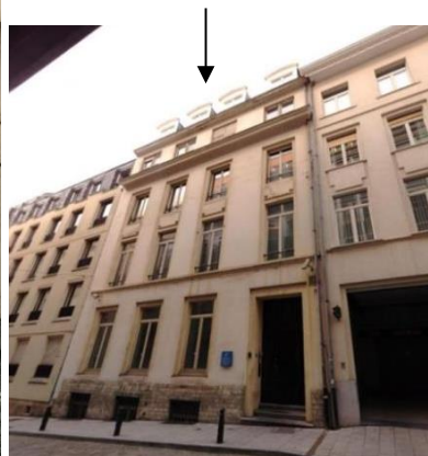
Implantation du bien, front bâti de la rue Thérésienne et façade à rue concernée