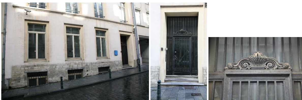
Façade du rez-de-chaussée avec le portail d'entrée et la porte en fer forgé

La CRMS approuve les grandes lignes du projet de rénovation qui contribuera à la pérennité du bien. Concernant la façade sur rue, le remplacement des châssis de fenêtres – de facture assez récente – n'appelle pas de remarques d'ordre patrimonial, pour autant que les profils et les divisions des nouvelles menuiseries se conforment à la typologie néoclassique du bien et améliorent la situation existante. La CRMS recommande de se baser sur la typologie de châssis anciens qui seraient conservés sur des immeubles similaires. La réussite de l'intervention résidera aussi dans le détail et la qualité des profilés, ce qui participera à la valorisation de l'ensemble de la façade.