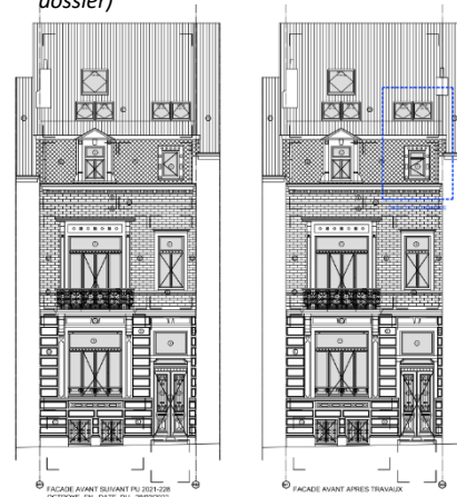
Façade avant du bien concerné par la demande (photographie extraite du dossier)