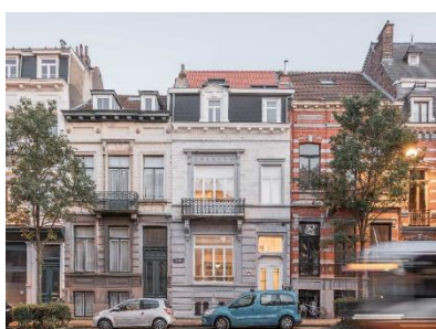
Situation de droit et situation de fait, avec indication des éléments à régulariser (documents extraits du dossier)