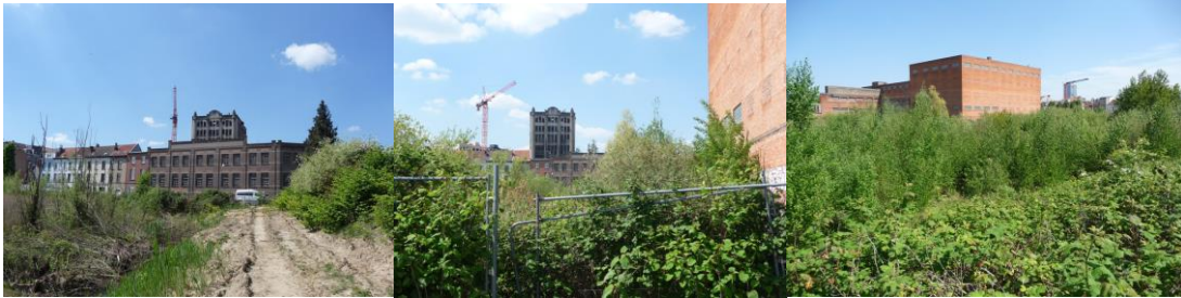
Vues vers les anciennes brasseries Atlas et vers l'ancien bâtiment des Archives de l'État

Réminiscence des étangs et du ruisseau autrefois présents dans cette zone avant le début de l'urbanisation et de l'industrialisation du quartier, le marais de Biestebroeck se distingue aujourd'hui par le dialogue visuel qu'il instaure entre sa végétation et les bâtiments industriels qui l'entourent, notamment la tour des anciennes brasseries Atlas.