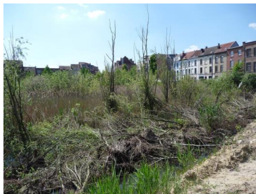
La roselière (photo CRMS, mai 2025)

Le marais incarne un retour spontané à l'état naturel d'un site avant son urbanisation. Situé à proximité immédiate du canal — reconnu comme corridor écologique — il s'intègre dans le maillage vert de la Région, en lien avec d'autres zones humides ou végétalisées situées le long du canal, de la Senne ou de ses affluents. Par ailleurs, de nombreuses observations naturalistes ont permis d'y recenser 160 espèces différentes, dont 73 plantes, 48 insectes, 2 mollusques, 1 amphibien, 2 mammifères et 33 espèces d'oiseaux. La roselière offre à ces espèces un lieu d'alimentation, de protection, de nidification, et constitue également une halte migratoire essentielle pour de nombreux oiseaux. Le marais représente un maillon important dans un réseau écologique menacé par l'urbanisation croissante.