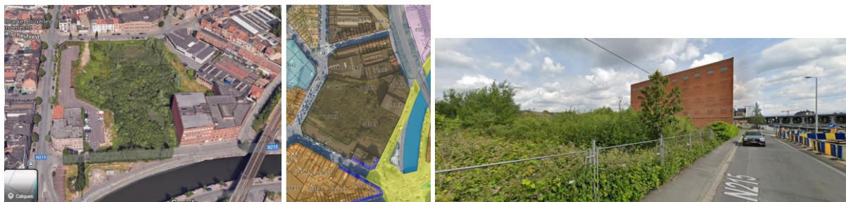
Vue aérienne (© Google maps), périmètre proposé au classement (parc. B307k5 et B307g5) (© Brugis) et vue du site (© Google maps)

Le marais Biestebroeck est situé à Anderlecht, sur la rive gauche du canal Bruxelles-Charleroi. La demande de classement introduite par l'asbl « Bruxelles Nature » porte sur une zone d'environ 1,5 hectare (parcelles B307k5 et B307g5) située en zone à forte mixité au PRAS. Le marais proprement dit s'étend sur environ 1,3 hectare et a émergé entre 2005 et 2009, par suite de l'abandon du site par l'entreprise Shell (en 1994) et son nettoyage. Le terrain appartient à la société privée The Dock.