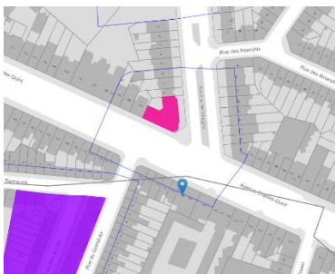
Contexte patrimonial

En réponse à votre courrier du 11/08/2025, nous vous communiquons l'avis émis par la CRMS en sa séance du 20/08/2025, concernant la demande sous rubrique.