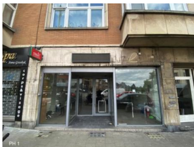
Devanture existante (doc. extrait du dossier)