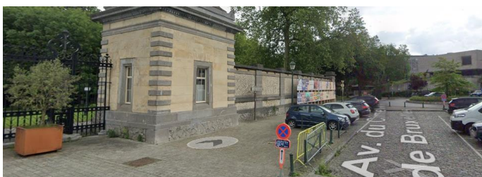
Vue vers le mur concerné depuis l'entrée du Cimetière de Bruxelles.