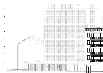
Elévation de la situation existante.