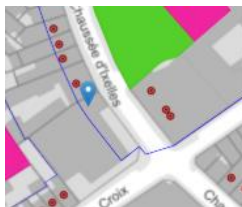
Situation patrimoniale

En réponse à votre courrier du 07/10/2025/2025, nous vous communiquons l'avis émis par la CRMS en sa séance du 15/10/2025, concernant la demande sous rubrique.