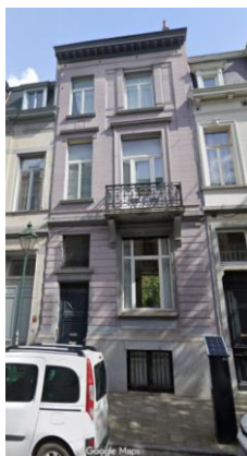
Façade à rue.