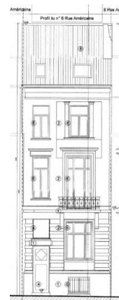
Élévation projetée de la façade à rue. Image tirée du dossier de demande.