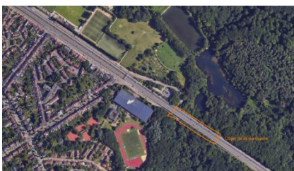
Zone d'intervention – extr. du dossier de demande

L'arrêté royal du 2 décembre 1959 classe comme site l'ensemble formé par la Forêt de Soignes et le Bois des Capucins sur les territoires des communes de Auderghem, Duisbourg, Hoeilaart, La Hulpe, Rhode Saint-Genèse, Tervuren, Uccle, Waterloo, Watermael-Boitsfort et Woluwe-Saint-Pierre;