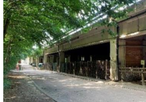
Situation existante – photos extr. du dossier de mande