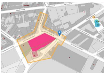
Contexte patrimonial

En réponse à votre courrier du 19/12/2025, nous vous communiquons l'avis émis par la CRMS en sa séance du 14/01/2026, concernant la demande sous rubrique.