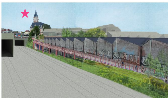
1. Le long du bâtiment Mondia - Langs het Mondia-gebouw

En réponse à votre courrier du 07/01/2026, nous vous communiquons l'avis émis par la CRMS en sa séance du 14/01/2026, concernant la demande sous rubrique.