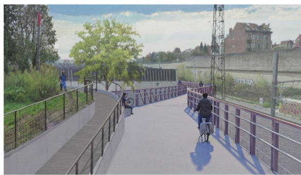
2. À l'entrée du pocket parc - Bij de ingang van het pocketpark

Simulation 3D de la situation projetée. Document extrait du dossier