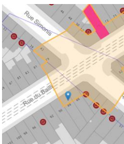
Contexte patrimonial

En réponse à votre courrier du 24/12/2025, nous vous communiquons l'avis émis par la CRMS en sa séance du 14/01/2026, concernant la demande sous rubrique.