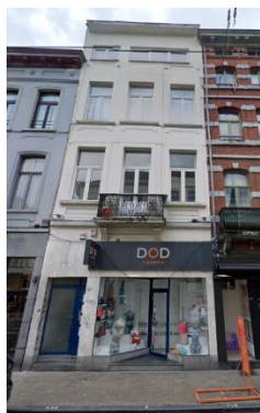
Vue de la façade à rue (photographie extraite du dossier).