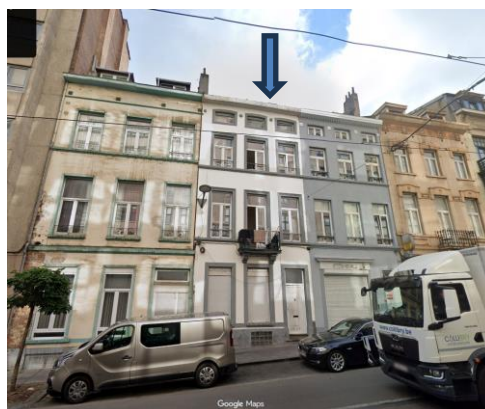
Photo de l'immeuble (indiqué en bleu).