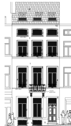
Élévation à rue. Situation projetée. Extrait du dossier

Les interventions en façade avant et arrière n'ont pas d'impact négatif sur les perspectives vers et depuis la maison Art déco classée. La restauration de la façade, tout comme le remplacement des châssis par des nouveaux châssis en bois et la restitution du garde-corps du balcon sont positifs. En ce qui concerne les transformations intérieures, il y a lieu de conserver d'éventuels éléments ou décors à valeur patrimoniale.