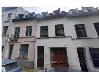
Situation existante et vue de la maison dans l'enfilade néoclassique (photographies extraites du dossier)