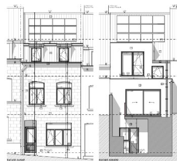
Situation projetée (document extrait du dossier)

La CRMS accueille favorablement le remplacement de la porte de garage par une fenêtre. Afin d'améliorer la cohérence de cette enfilade néoclassique, elle recommande, dans la mesure du possible, d'aligner les dimensions de la nouvelle baie sur celles des fenêtres des rez-de-chaussée des maisons voisines, et d'en restituer le cintrage. Les autres aspects du projet n'ont pas d'impact négatif sur les vues vers et depuis les cités-jardins et relèvent d'un examen d'ordre urbanistique.