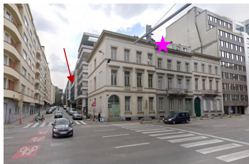
Localisation du projet © Google Maps