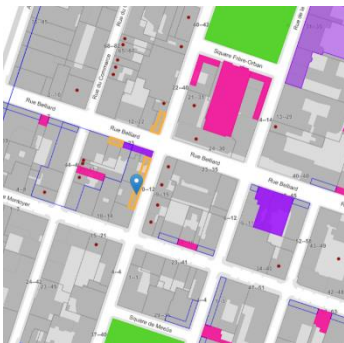
Localisation du bien

En réponse à votre courrier du 28/01/2026, nous vous communiquons l'avis émis par la CRMS en sa séance du 04/02/2026, concernant la demande sous rubrique.