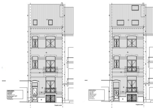
Elévations existante et projetée (extraits du dossier)