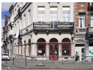
État existant