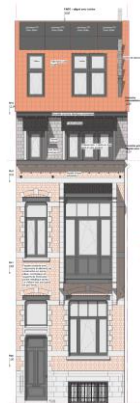
Plan d'élévation extrait de la demande