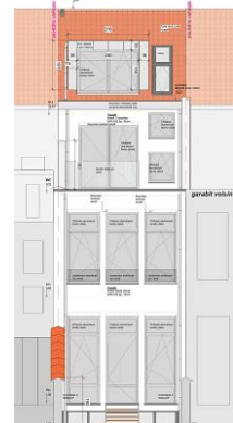
Plan d'élévation extrait de la demande

Au regard de la situation de droit, les transformations projetées ne seront pas davantage perceptibles depuis le bien inscrit au patrimoine mondial, compte tenu notamment de la distance qui sépare les deux biens.