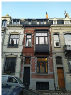
État existant de la façade sur rue